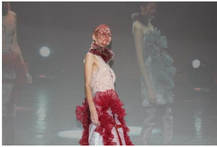
BFGU ファッション・ショー