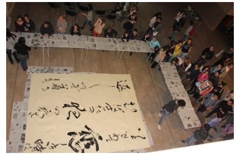
書道ワークショップ