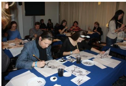
墨絵ワークショップ