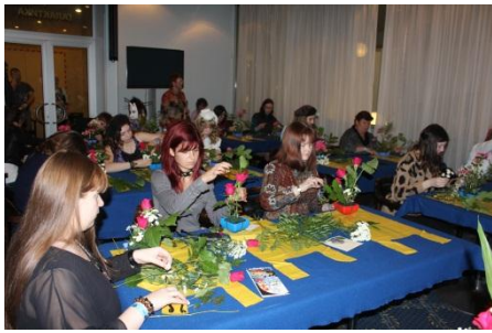
生け花ワークショップ