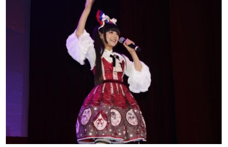
上坂すみれミニライブ