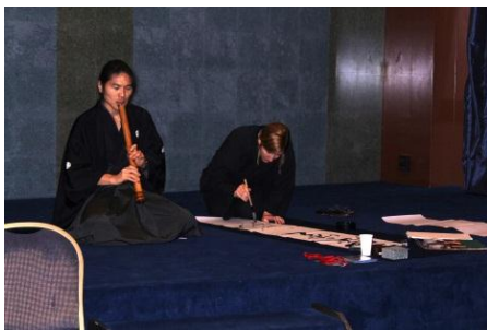
尺八と書道のデュエット