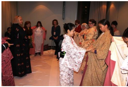
着付けワークショップ