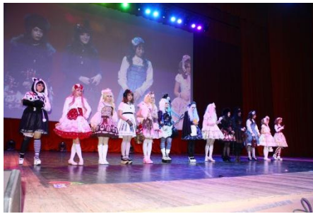
ロリータコンテスト