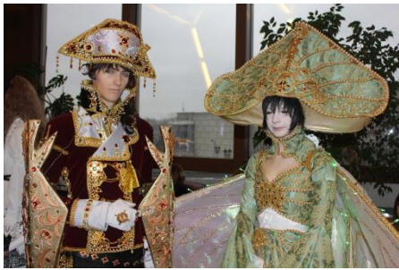
ロシア全国コスプレ大会