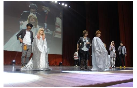
Ash のヘアメイクショー