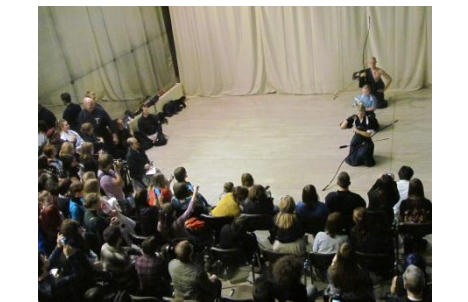
武道デモンストレーション