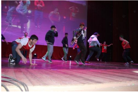
日露ダンスバトル