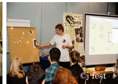
Мастер-класс по игре в Го