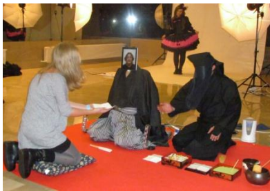
Виртуальная чайная церемония