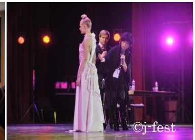
Лекция о моде