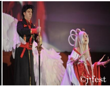
Всероссийский конкурс косплея