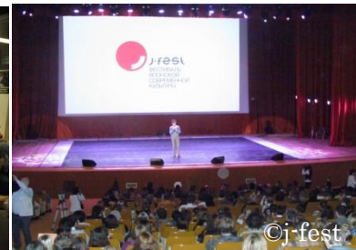
Приветствие от лица организатора