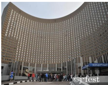
Гост.«Космос»: очередь на вход

Программа фестиваля отличалась большим разнообразием: в его рамках состоялись лекция известного писателя Кодзи Судзуки, автора книги, по которой был снят фильм ужасов «Звонок», концерт танцевального коллектива «Чура» с островов Окинава, выступление японских и российских танцоров в стиле Street Dance, концерт певицы Юи Макино, экспозиция визуального искусства Университета Киото Сэйка, экспозиция персонажей японских мультфильмов, (организатор Японский фонд), демонстрация новых японских фильмов, показ моды стилей Готик-лолита и Харадзюку, Всероссийский конкурс косплея, лекции и мастер-классы по манга, показательное выступление по кэндо и другие мероприятия. За два дня в фестивале приняли участие более 15 тысяч россиян самых разных возрастных категорий.