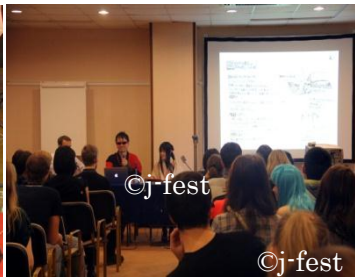
Мастер-класс по манге