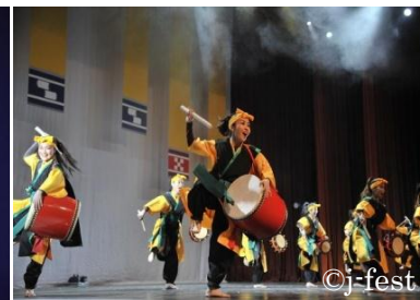
Концерт ансамбля «Чура»