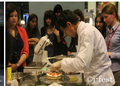
Мастер-класс кондитерского искусства