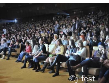
Концертный зал заполнен до отказа,