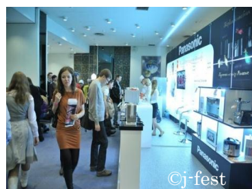
Стенды японских компаний,