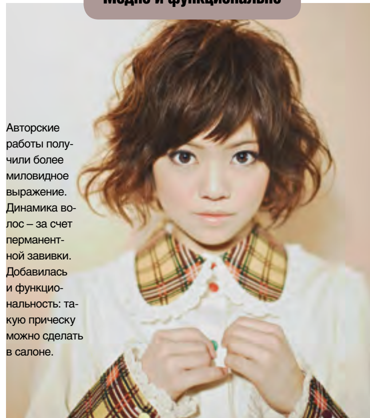
ФОТО: HAIR TAKAMASA TAGUCHI, MAKEUP IKUKO HOSHINO

ФОТО: ASH CO., LTD, CLOTHES: ALICE AND THE PIRATES