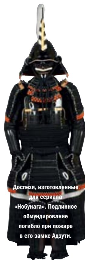
Доспехи, изготовленные для сериала «Нобунага». Подлинное обмундирование погубило при пожаре в его замке Адзути.

сразу же попали в водоворот придворных заговоров, атмосферу жестокости и недоверия. Иван IV всегда производил впечатление странного, почти ненормального юноши; прозвище «Большой дурак из Овари» Нобунага получил из-за своего эксцентричного поведения, любви к диковинным вещам и причудливым одеждам. Его «выходки» долго мешали старейшинам клана воспринимать юношу всерьез. После смерти отца молодого Нобунаги, не имея на это права, попытались захватить власть в клане. К двадцати пяти годам, убив одного из братьев, Нобунага объединил клан и возмечтал объединить страну. Первыми жертвами его агрессивной политики пали два соседских рода – Имагава и Сайто. Перед решающим боем с войсками Имагава Нобунага выступил в роли самурая из известной пьесы театра Но. В ней рассказывается, как самурай убил своего 16-летнего противника, затем стал монахом и встретился с духом своей жертвы.